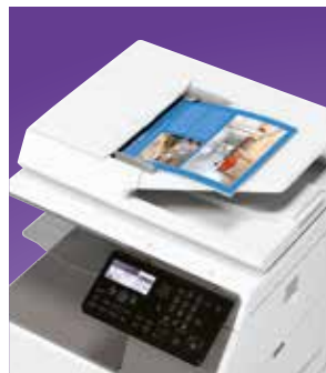
Farebné skenovanie po sieti